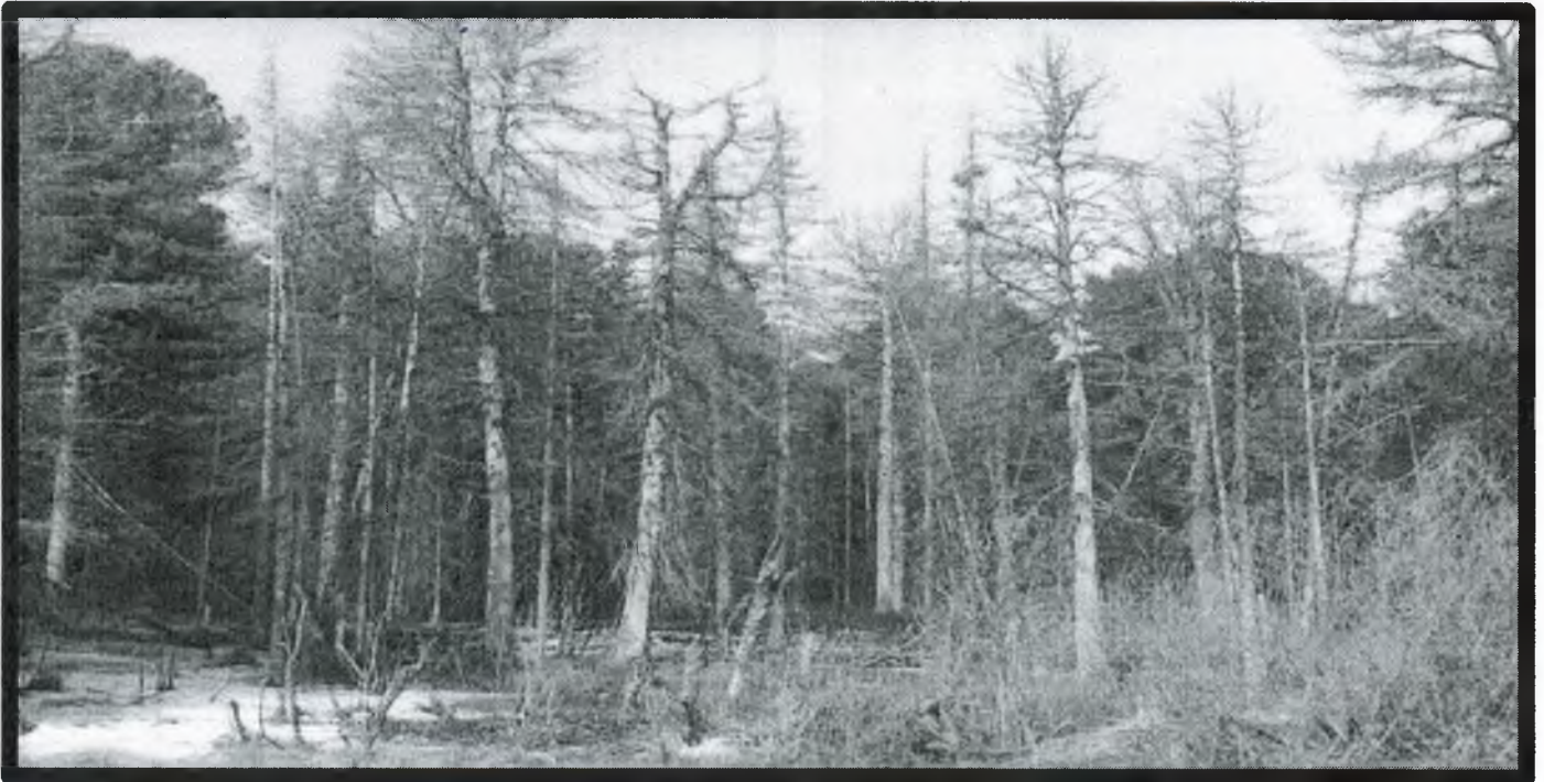
Изображение № 4 Сухостойное дерево. Не является валежником

Кроме того, необходимо обратить внимание, что деревья, которые лежат на земле, но не имеют признаков естественного отмирания (имеют зеленую листву или хвою), определять как «мертвые» не допускается ( смотри изображение № 5 ).