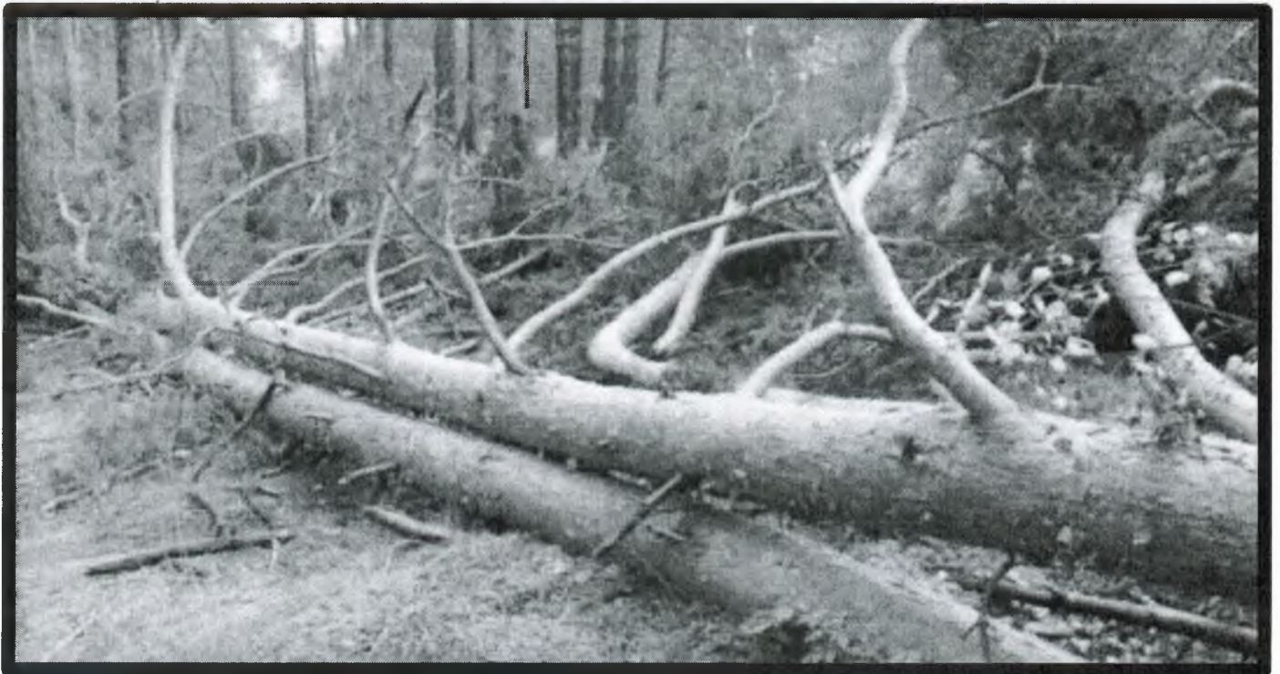
Изображение № 5 Лежащее на поверхности земли ветровальное дерево, не имеющее признаков отмирания. Не является валежником

Ветровальные деревья (вывернутые с корневищем) не являются мертвыми деревьями, хотя они лежат на земле, но могут продолжать жить, расти и даже давать потомство (вегетативное).